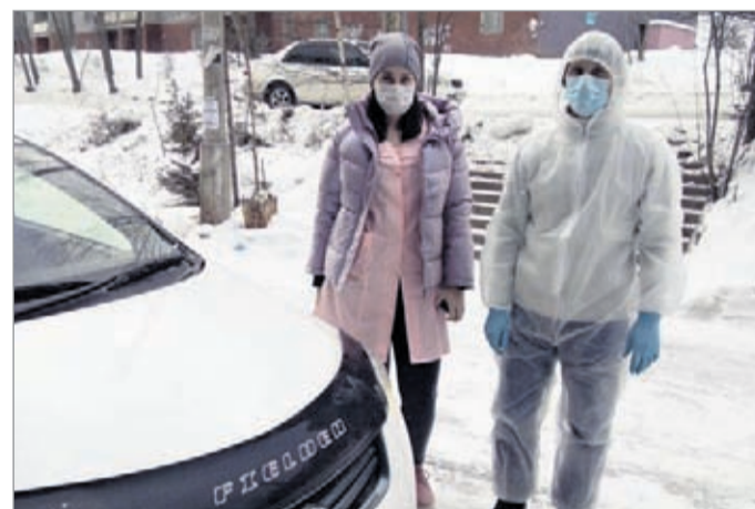
Волонтеры на личных автомобилях помогают медикам в оперативности оказания помощи пациентам на дому

Работа продолжается, ситуация в городе по-прежнему остается очень серьезной. Поэтому обращаемся