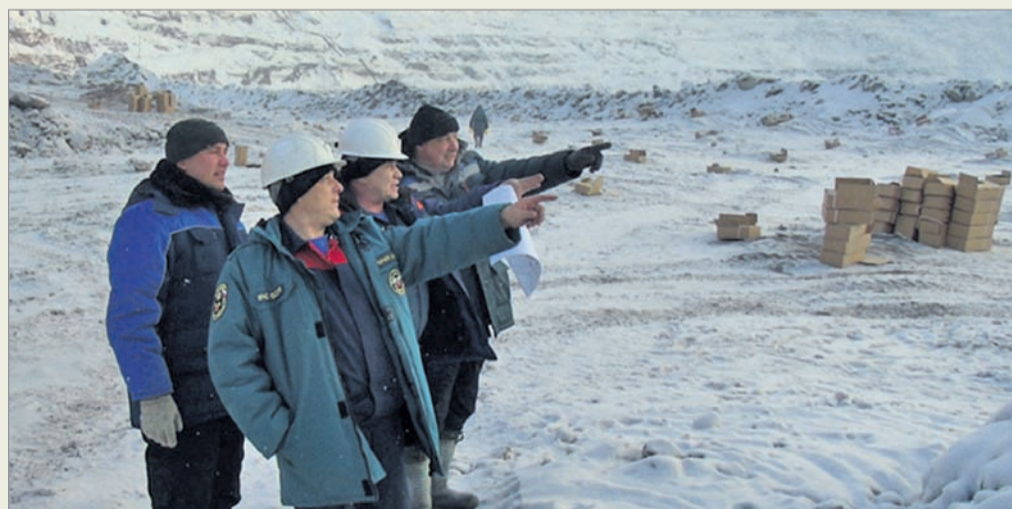
Совместная детализация оперативных задач руководством ВГСЧ и мастерами «Взрывпрома Юга Кузбасса»