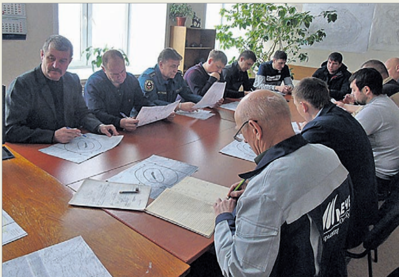
Совещание руководителей подразделений Коршунковского ГОКа по проведению очередного массового взрыва

— Через 15 минут после производства массового взрыва в Коршунском карьере и на Рудногорском руднике в обязательном порядке производятся замеры состояния рудничной атмосферы. На место выезжают четыре специалиста: руководитель взрывных работ, командир отделения ВГСП и два респираторщика. С использованием газоанализатора и индикаторных трубок делается экспресс-анализ и отбираются пробы для более подробного анализа состояния воздуха в контрольно-измерительной лаборатории. Опираясь на свой опыт и опыт коллег, твёрдо скажу: после производства массового взрыва мы не фиксируем превышения предельно-допустимой